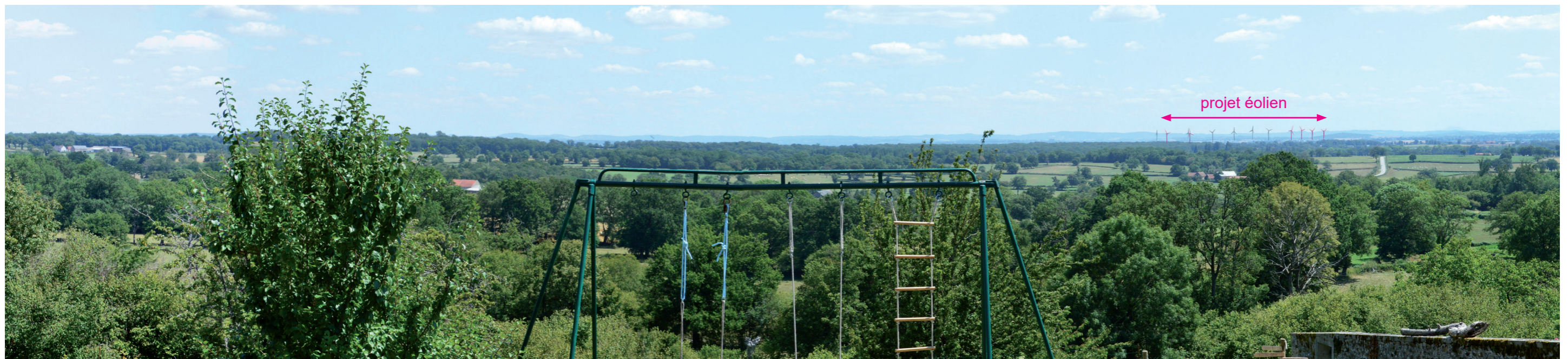
Photographie 118 : Vue en esquisse sur le projet éolien depuis Lépaud, village que traversent les GR41 et 46 (Vue 4 du carnet de photomontages en annexe).

Comme dans le cas du GR46, quelques visibilités lointaines sont identifiées comme à proximité du village de Lépaud (Vue 4 du carnet de photomontages en annexe). Plus au sud, d'autres vues assez furtives seront possibles à l'approche du bourg de Chambon-sur-Voueize, en l'absence de végétation à proximité du chemin. L'impact du projet éolien sur le GR41 est très faible .