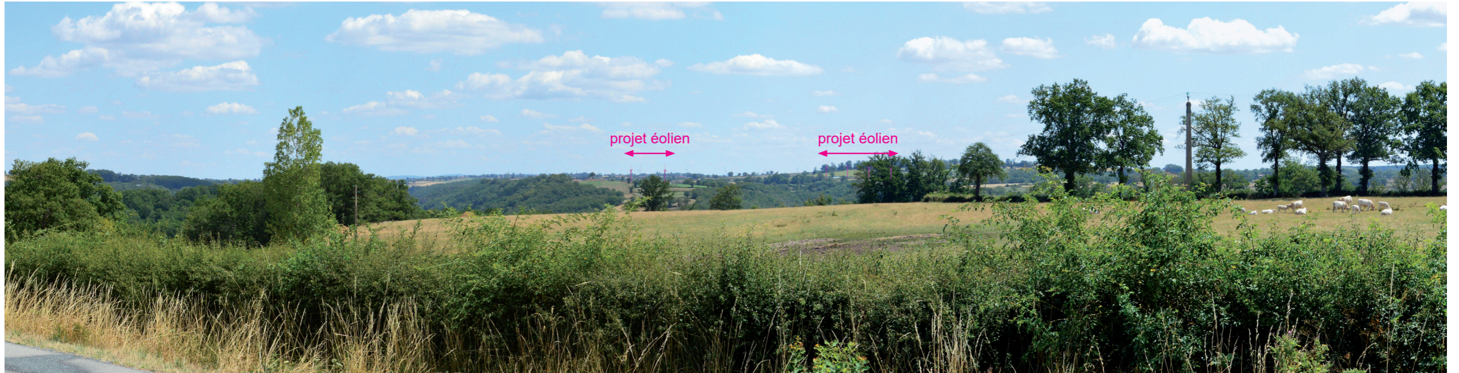
Photographie 117 : Vue en esquisse sur le projet éolien depuis la limite ouest du site emblématique de la vallée de la Tardes et de la Voueize (Vue 5 du carnet de photomontages en annexe).